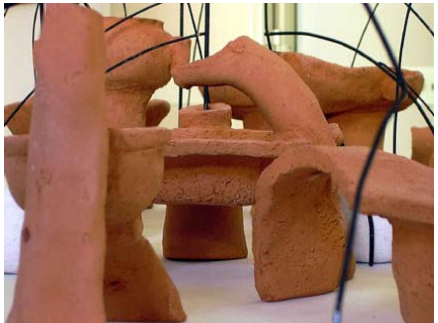
SUONI D'ARIA E D'ACQUA 1997/2003 Terracotta ferro acqua pietre (particolare)