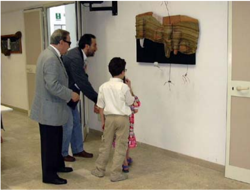
LACRIMATOI 1997 Corda terracotta ferro legno pietre