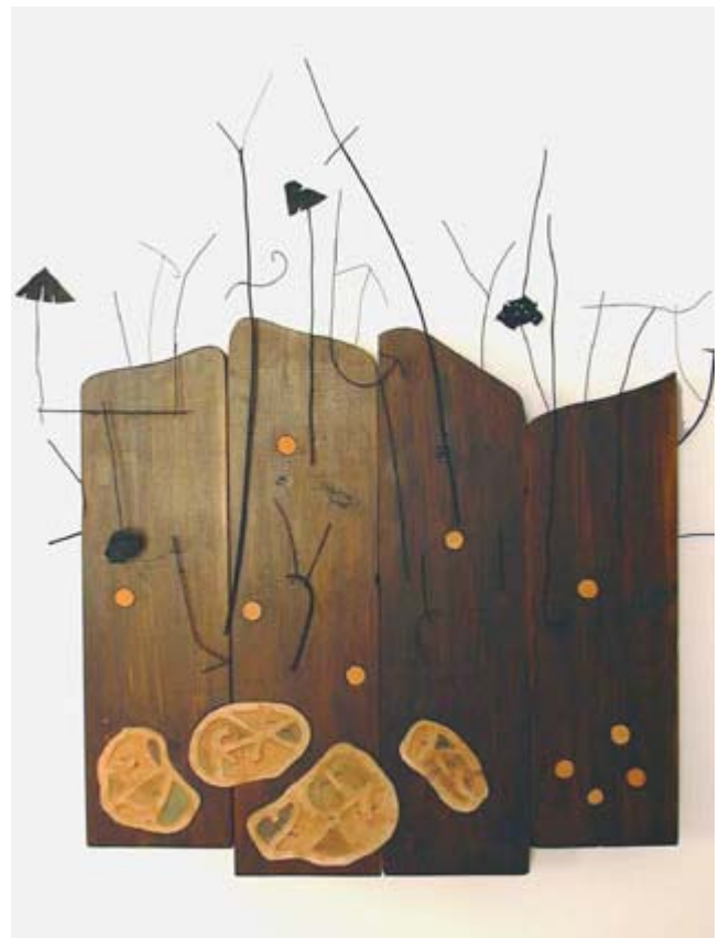
STORIE DI PAROLE AL VENTO 1991 Legno ferro terracotta